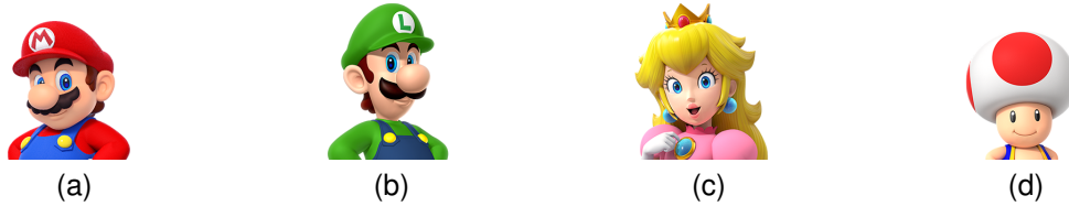
FIGURA 3 – Exemplo de subfiguras simples.