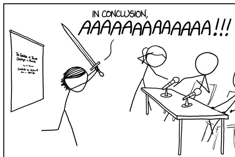
FIGURA 2 – Exemplo de figura.

THE BEST THESIS DEFENSE IS A GOOD THESIS OFFENSE.