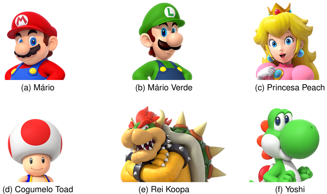
FIGURA 4 – Exemplo de subfiguras com legendas individuais.