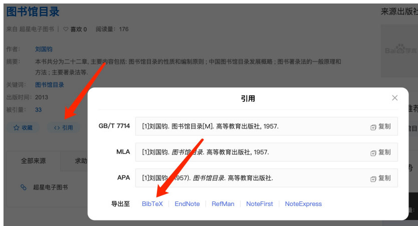
图 1-2 使用学术搜索查找文献引用代码

首先，使用各种学术搜索，查找需要引用的参考文献，然后点击“引用”，如图 1-2 所示 [1] 。