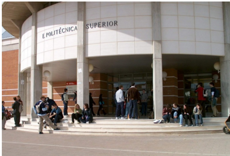
Figura 2.1: Escuela Superior de Ingeniería Informática. Esto es un texto descriptivo algo más largo que puede producir un efecto feo.