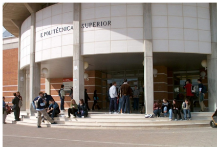
(a) Fotografía de la izquierda

Se incluye el paquete subfigure para la inclusión de figuras con varias imágenes o gráficas, como la que muestra la figura 2.3.