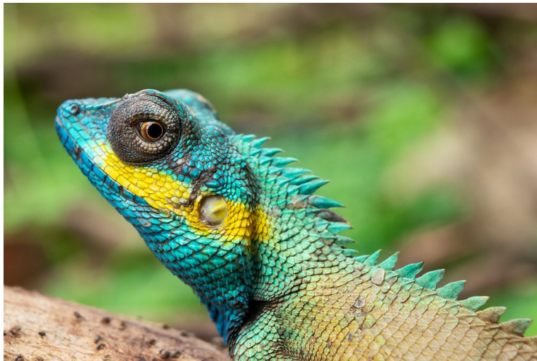
Figure 2. A JPG image of a lizard