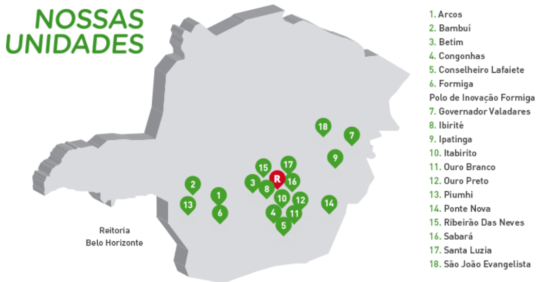
Figura 4 – Mapa de unidades do IFMG.