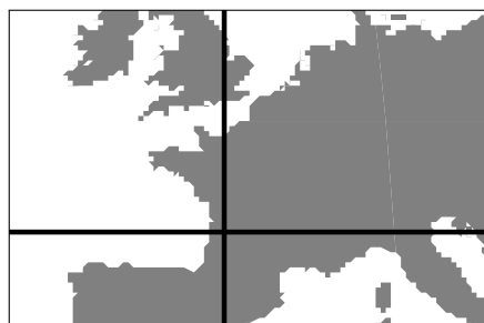
FIGURE 3 – Zoom sur la Fig 2.