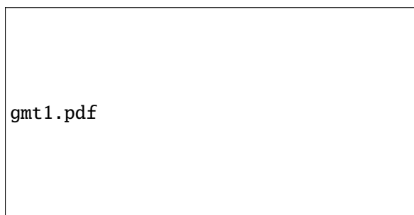
FIGURE 4 – Comme la Fig 2, mais en draft.