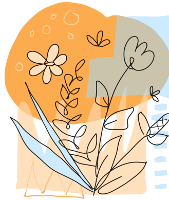
(a) Sub-caption 1