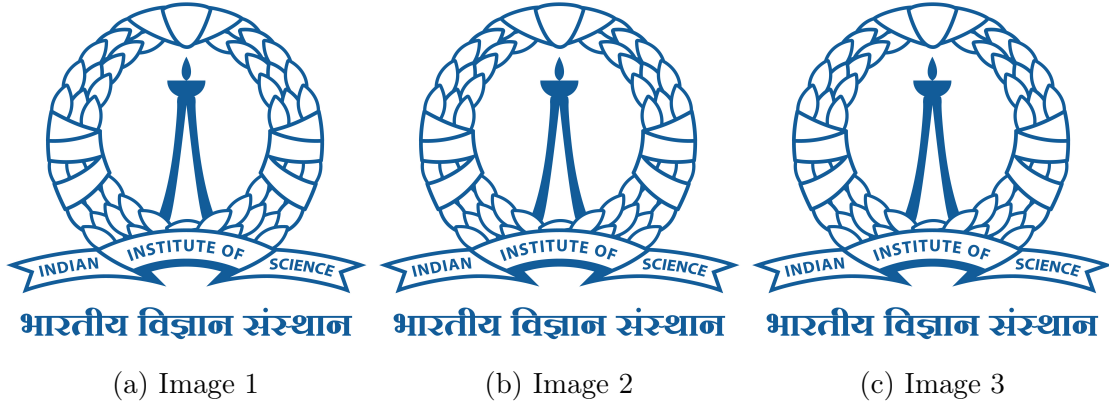
Figure 1.1: Various Images

Nulla malesuada porttitor diam. Donec felis erat, congue non, volutpat at, tincidunt tristique, libero. Vivamus viverra fermentum felis. Donec nonummy pellentesque ante. Phasellus adipiscing semper elit. Proin fermentum massa ac quam. Sed diam turpis, molestie vitae, placerat a, molestie nec, leo. Maecenas lacinia. Nam ipsum ligula, eleifend at, accumsan nec, suscipit a, ipsum. Morbi blandit ligula feugiat magna. Nunc eleifend consequat lorem. Sed lacinia nulla vitae enim. Pellentesque tincidunt purus vel magna. Integer non enim. Praesent euismod nunc eu purus. Donec bibendum quam in tellus. Nullam cursus pulvinar lectus. Donec et mi. Nam vulputate metus eu enim. Vestibulum pellentesque felis eu massa.