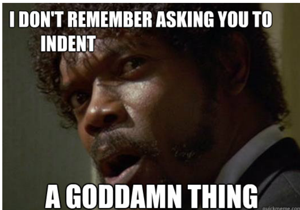
Obrázek 5.3: Nejste v tom sami.