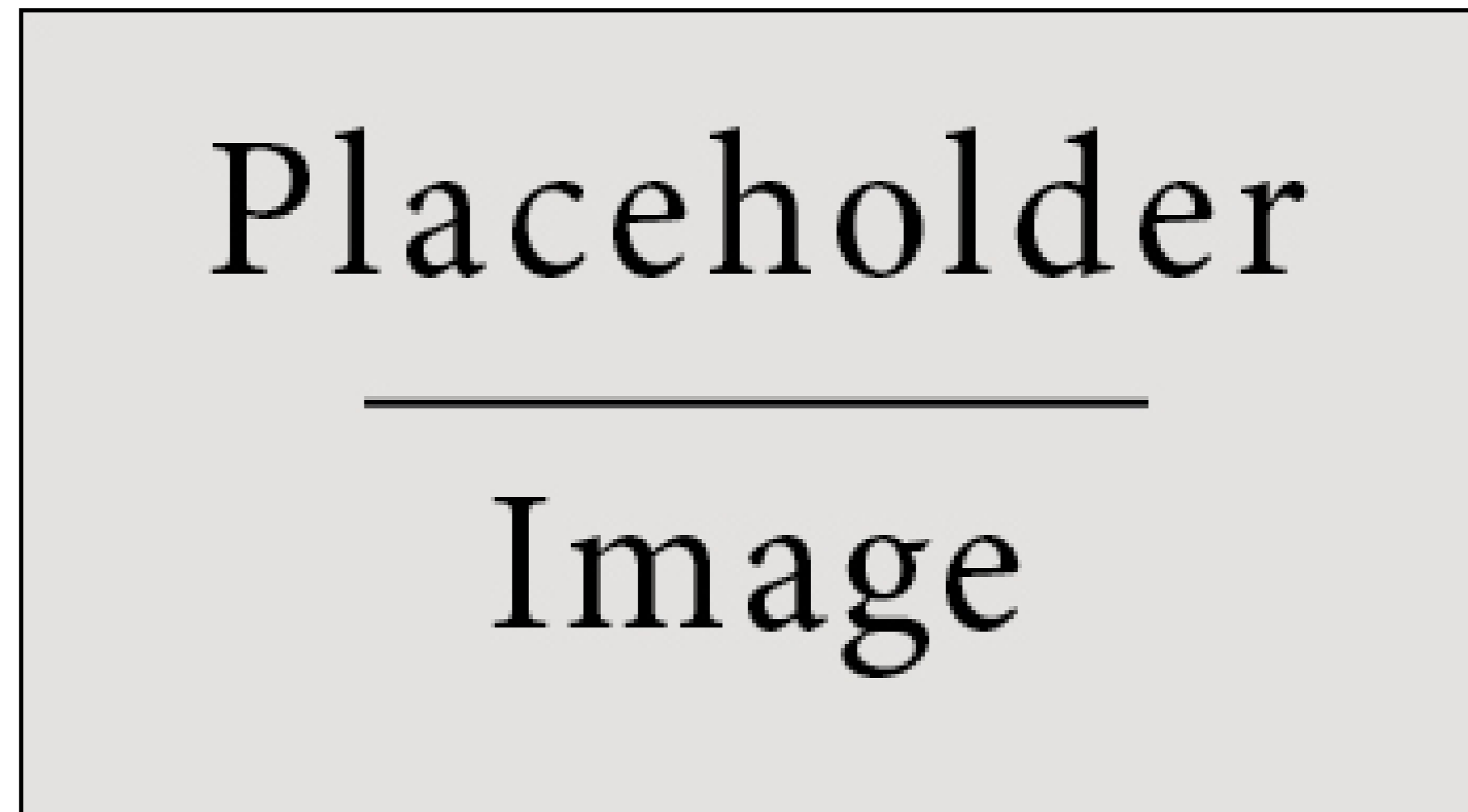
Figure 1: Figure caption

consectetur non commodo. Pellentesque condimentum dui. Etiam sagittis purus non tellus tempor volutpat. Donec et dui non massa tristique adipiscing. Quisque vestibulum eros eu. Phasellus imperdiet, tortor vitae congue bibendum, felis enim sagittis lorem, et volutpat ante orci sagittis mi. Morbi rutrum laoreet semper. Morbi accumsan enim nec tortor consectetur non commodo nisi sollicitudin.